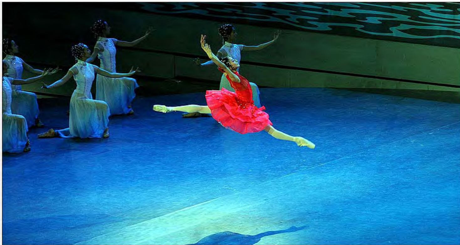
En la apertura hubo un espectáculo a cargo de 2.300 artistas que celebraron el eslogan de la Expo: "Una ciudad mejor, una vida mejor".