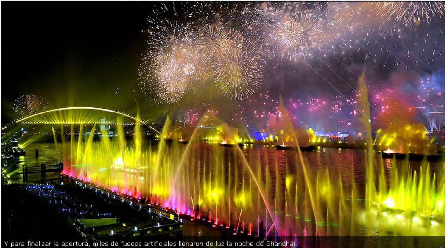
Y para finalizar la apertura, miles de fuegos artificiales llenaron de luz la noche de Shanghái.