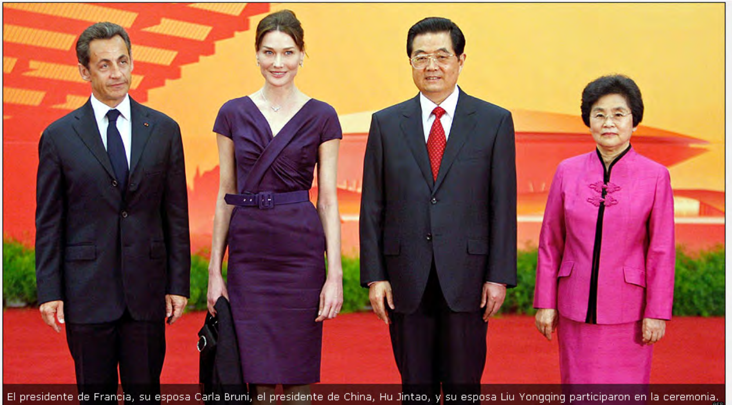
El presidente de Francia, su esposa Carla Bruni, el presidente de China, Hu Jintao, y su esposa Liu Yongqing participaron en la ceremonia.