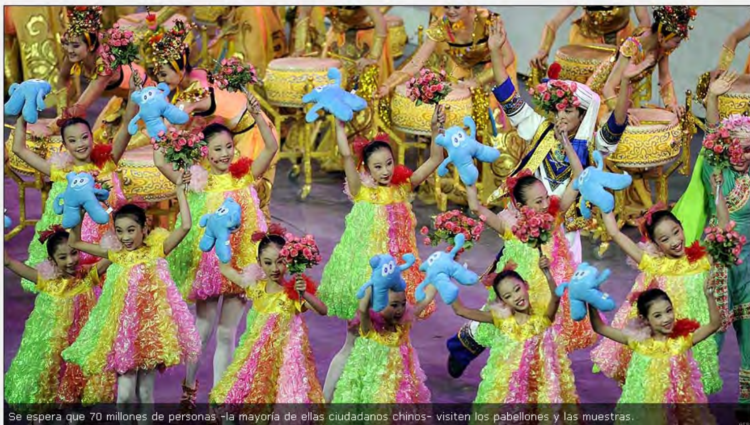
Se espera que 70 millones de personas -la mayoría de ellas ciudadanos chinos- visiten los pabellones y las muestras.