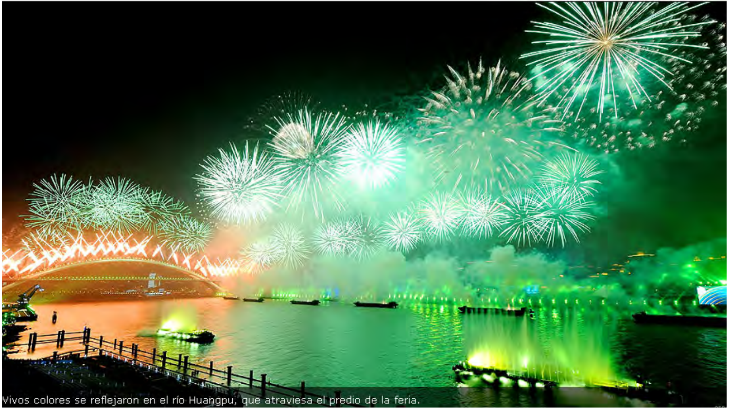
Vivos colores se reflejaron en el río Huangpu, que atraviesa el predio de la feria.