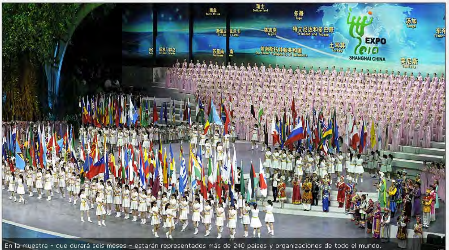
En la muestra - que durará seis meses - estarán representados más de 240 países y organizaciones de todo el mundo.