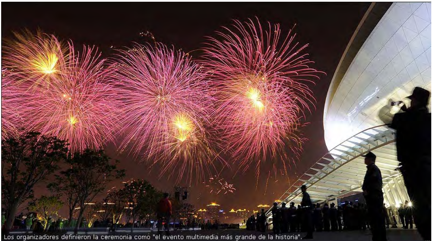
Los organizadores definieron la ceremonia como "el evento multimedia más grande de la historia".